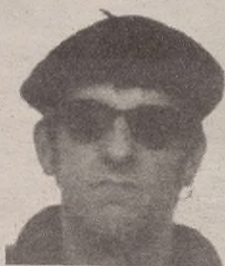
"Eskerrak The Balde eta Putz geratzen zaizkigula"

zer den ETB, eta zer suposatzen duen Sorginen Laratza bezalako programak pantailaratzeak. Agian, betidanik eta "tradizionalki" (hitzari kiratsa badario ere) berezko euskal kulturaren barruan ez zeuden edukiak erakustea dakar: Idiazabalgo Kontxesi Miss Euskadiren kuleroak ikustea gerta daiteke konturatu gabe. Positiboa da hau: euskaltasun horretatik "tradizionalki" (puaj) kanpoan