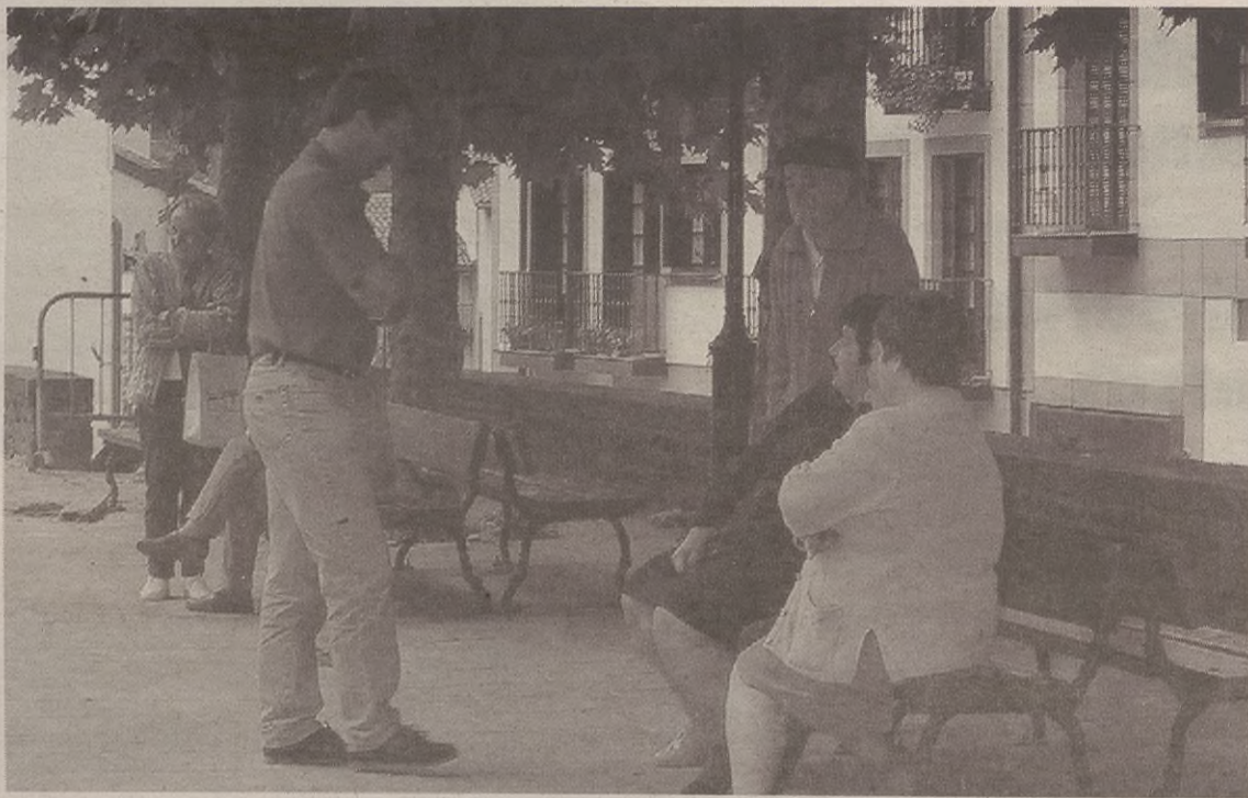
Apirilaren lehenengo astetik aurrera hartu ahal izango dira inprimakiak Udalean.

Bost adineko mota joan ahal dira oporretan IMSERSOren eskaintza horrekin: 65 urte edo gehiago dituzten adinekoak; pentsioen sistema publikoko erretiro-pentsioa hartzen dutenak; 60 urte bete dituzten pentsiodunak, betiere, pentsioen sistema publikoen barrukoak bada; eta pertsona nagusia elbarria bada, haren semea edo alaba lagun moduan joatea onartuko dute, baldin eta pertsona nagusiaren elbarritasun maila %45 edo gehiago bada. Eta horrez gain, pertsona nagusiarekin doan laguna ezkontidea bada, ez ditu zertan bete adi-