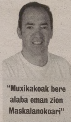
"Muxikakoak bere alaba eman zion Maskaiakoari"

Horrela bada, Muxikakoak bere alaba eman zion Maskaiakoari baldintza batekin: emazte gaztearekin umeren bat izanez gero, bailara Maskaiakoaren esku geratuko zen betiko; umerik jaio ezik, ordea, Muxikakoaren menpe izango zen lurraldea aurrerantzean. Maskaiako jauna