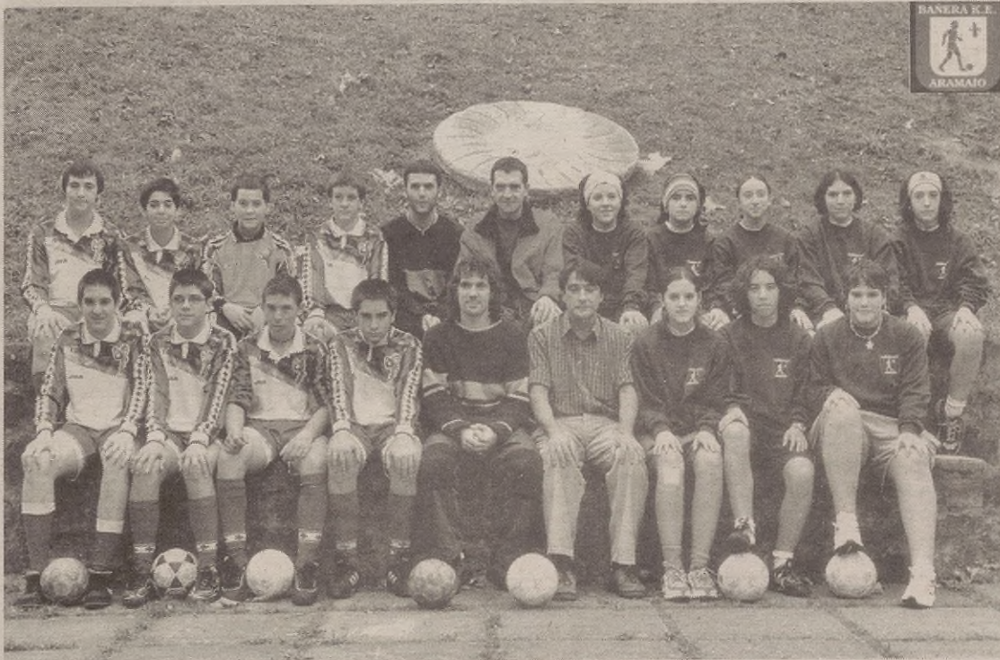
Mutilak eta neskek gertu izanez gero, aurrera segitzeko asmoa dute Bañera Kirol Elkartekoek.