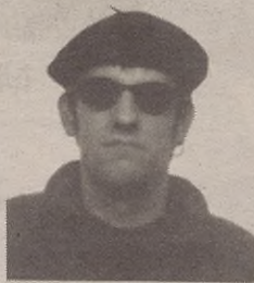
"Tonto del culo deitu zion kazetari ustez harroputz bati"