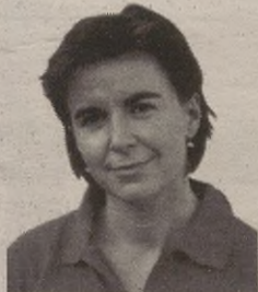
“Uztailaren 25etik aurrera eguraldi hobea iragarri dute”

Aholkuekin jarraituz, oporretan osasuna zaintzeko aholkua egiten dizuet. Inoiz ez