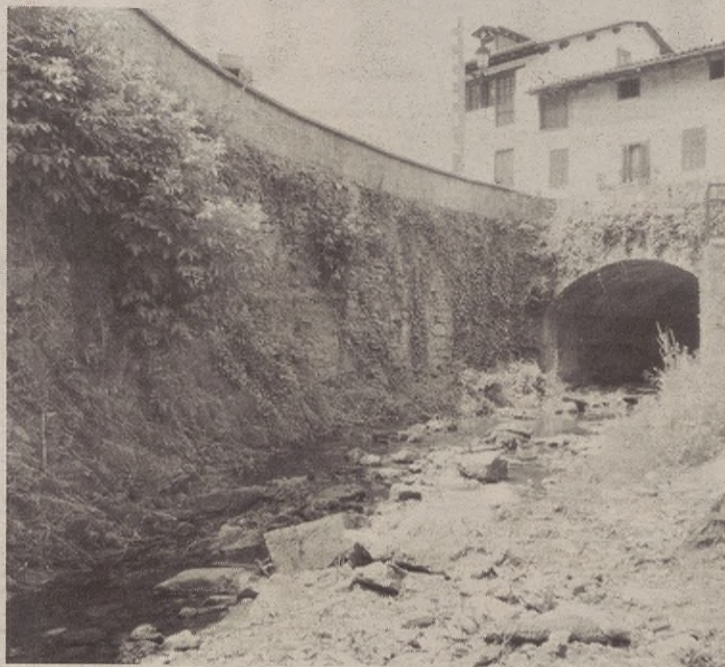
Ekainaren 24an abisatu zuten errekan isurketa zegoela.

Hilabete pasa da ordutik, eta Aramaioko Udalean ez dute inolako erantzunik izan. Are gehiago, oraindik ere isurketak berdin