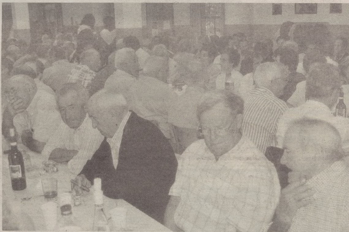
Bazkaldu eta gero, dantza egiteko saioa izango dute erretiratuek.

Berak kontatu digu zela 1965. urte inguruan eta herriko giroa apur bat mugitzeko helburuarekin talde bat sortu zen, eta Famili Buru Elkarte izena ipini zioten. Adibidez, gazteei Almenera joateko aukera emateko autobusa antolatu zuen elkarteak, Udalak ardura