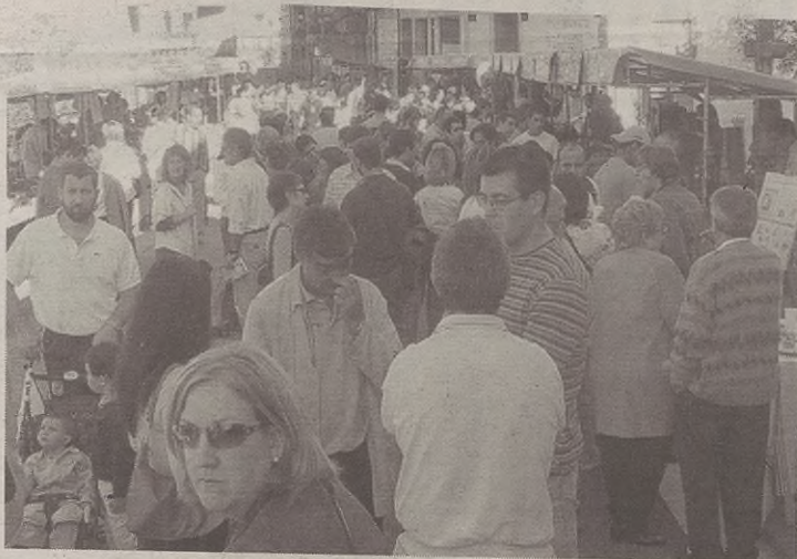
Jendea kalera irtetera animatu zen, saltokiak ikusi eta giroaz gozatzera.

Kontuak kontu, hōriek guz- tiek bat egin zuten eguraldi ede- rrekin, eta zapatu polita izan zen Aramaion.