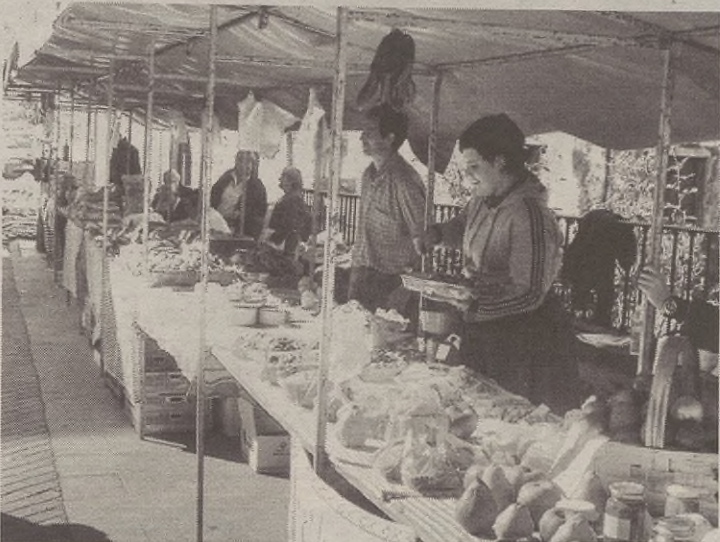
Guztira, zortzi herritarrek ipini zuten saltokia azokan.