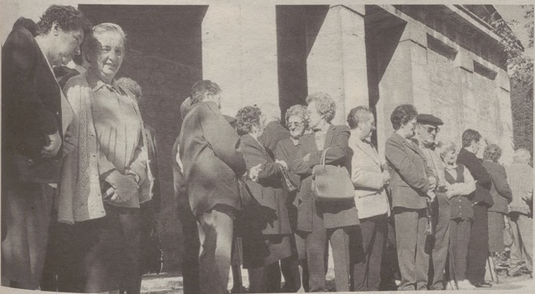
Parrokian batu ziren erretiratuak, besterik baino lehen, meza entzuteko.