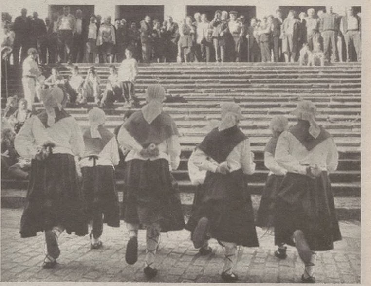
Lagun Artean dantza taldeak omenaldia egin zuten erretiratuari.