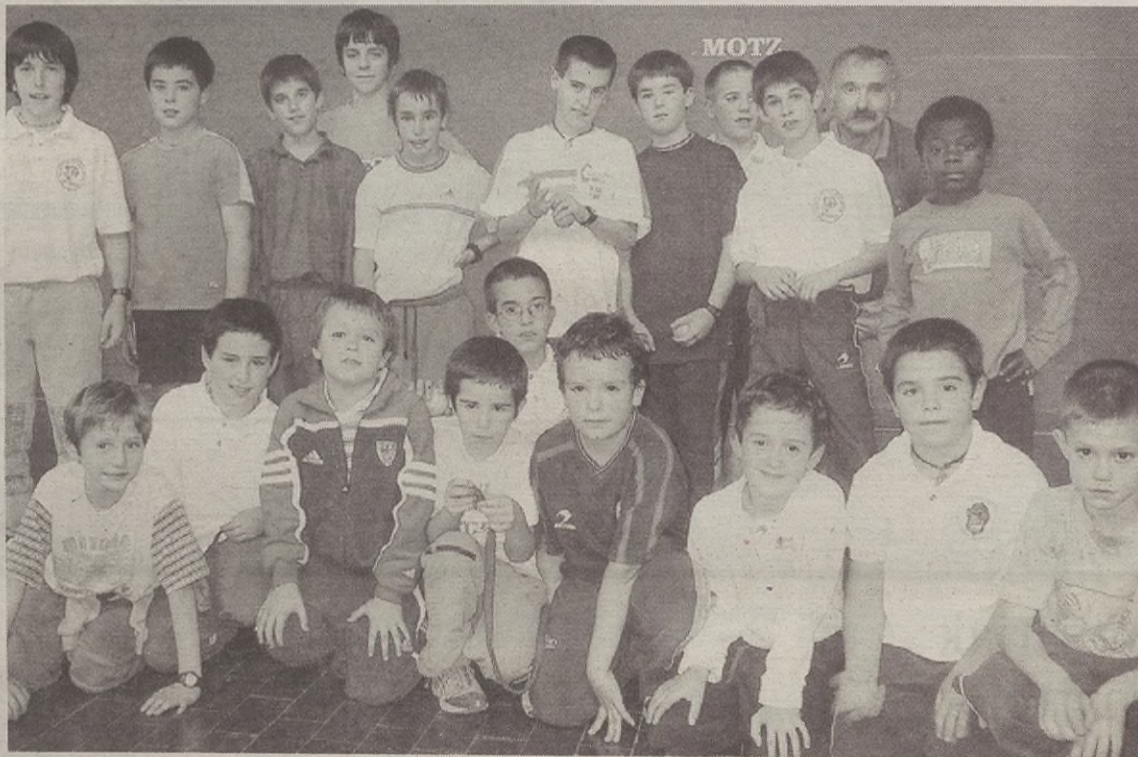
Hogei bat gaztek eman dute izena aurtun Barea pilota taldean.

Horrekin batera, aurtun, bestetan baino txapelketa gehiagotan par-