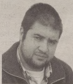
Zentzua erabiliz, bestelako mundua lortu dezakegu