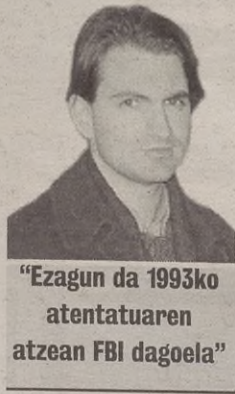
"Ezagun da 1993ko atentatuaren atzean FBI dagoela"

Dena dela, gero eta gehiagok uste du irailaren 11koa barruko ekintzaren bat izan dela. Estatu amerikarra atentatu horien atzetik dagoela erakusten duten gero eta frogak gehiago agertu