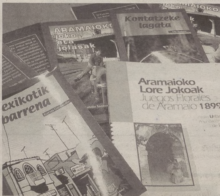
Badiharduguren salmahaian izango dira Aramaioko produktuak.

Kontuak kontu, Aramaioko lau argitalpen izango dira Durangoko Azokan: Aramaioko Joko eta Jolasak liburua, Aramaioko Lore Jokoen gainekoa, Sagitario Lehia-jokotetan irabazle izan diren euskarazko lanak (hiru, guztira) eta Tolerantzia izeneko beste liburu bat. Aramaioko Udalak beste herri