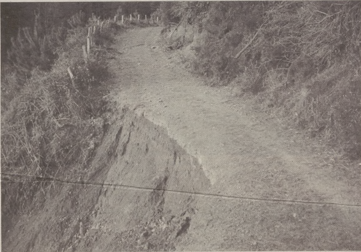
UDALEKO ZERBITZU TEKNIKOAK