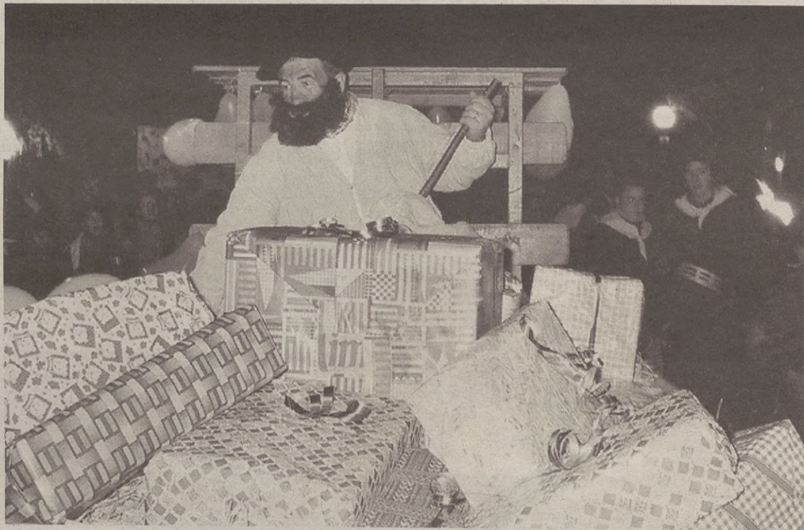
Arratsaldeko seietan egingo zaio harrera geure Olentzerori; pilotalekuaren ondoan, Olentzero menditik dator-eta.

Plazarako bidean gozokiak banatuko ditu Olentzerok. Eta, behin plazara iristen denean, Bixente Goikoetxea abesbatzako kideek Hator , hator abestia kantatuko diote. Gero, Sastiña ermitara sartuko da gure Olentzero, eta han umeen gutunak jasoko ditu eta oparitxoak emango dizkie. Bitartean, abesbatza kanpoan izango da, kantuan. Eta Olentzerorengana doazenendako gaztainak