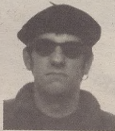
"Odol horrekin biziberri daitezela haien zainak"

Eta agian hori da txarrena, eta nire eta herri osoaren burua salatzen duena. Hamabost egun bizitza bat izan