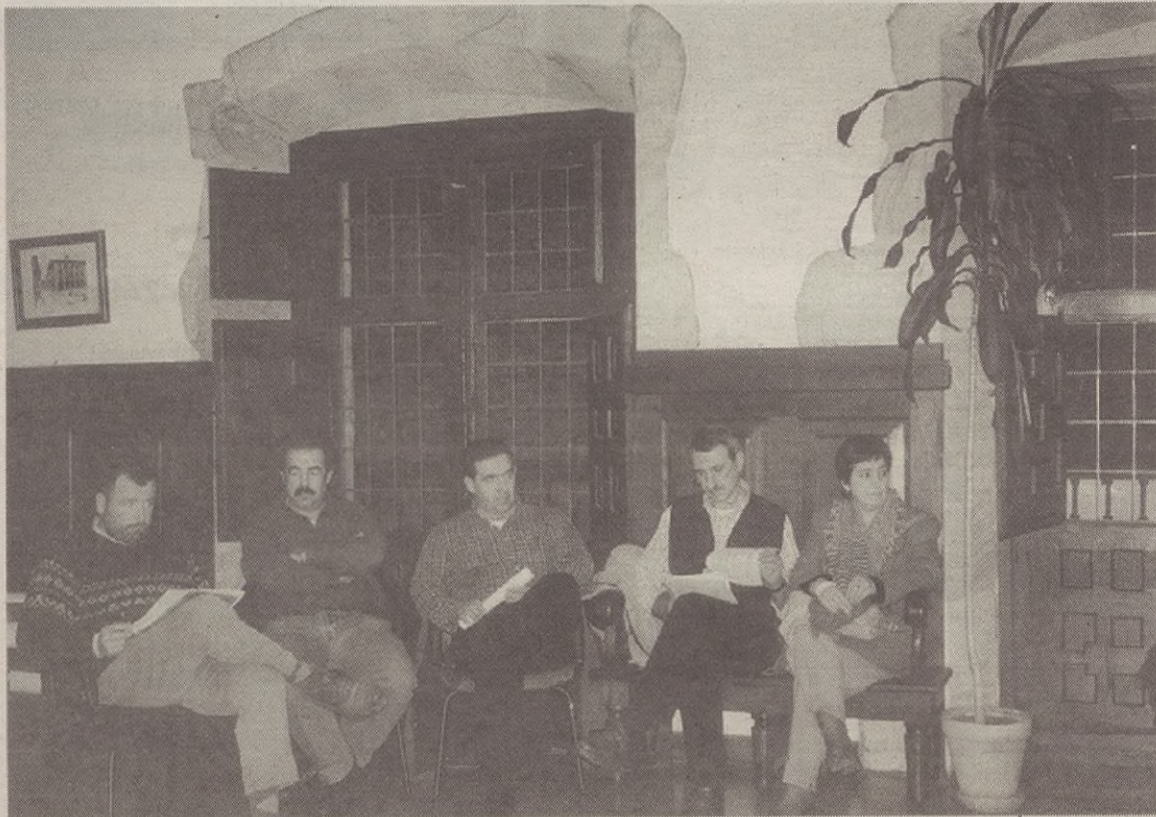
UDALEKO ZERBITZU TEKNIKOAK