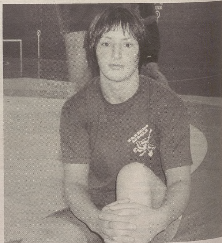
Irailean New Yorkera joango da Mainer Unda, Munduko Txapelketara.

Zuberotarrek bat Auzolanean kanpainaren antolatzaileek eskerak eman dizkie aramaiorrei kanpainan parte hartzeagatik. Adierazi dutenez, ekimen horri esker 401.745 euro batu dituzte. Eta elkarlan horretatik Euskal Garapen eta Kohesio Fondoa izeneko elkarte sortu dela jakinarazi dute. Elkarte horren bitartez kudeatuko dute Zuberorearen alde jasotako ekarpenak. Edozelan ere, litekeena da aurrera begira ekimen gehiago egitea. Bereiziki, kontuan hartuta hasierako helburua milioi bat euro batzea zela. Hortaz, oraindik badago zer egin Zuberorearen alde.