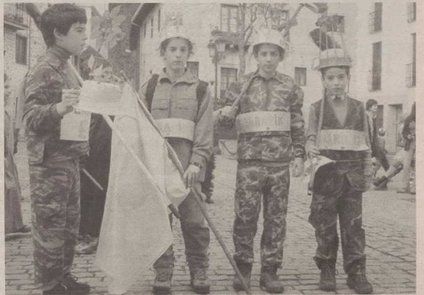
Lore eta guzti irten ziren zenbaitzuk gerraren kontra, armak etxean utzita.