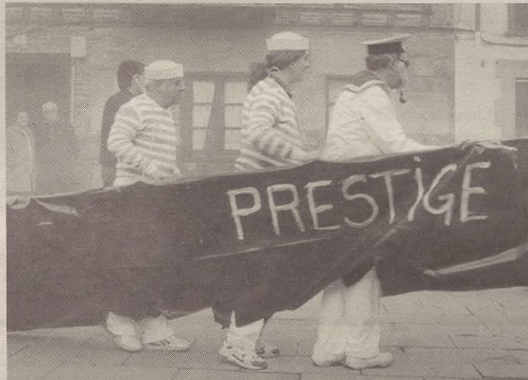
Hara! Galiziatik hanka egin eta Aramaiora etorri zaigu Prestige , fuel-olio eta guzti!

San Martin Eskolan, umeek dantzaldia, jolasak, txokolate jana eta giro ederra izan zuten