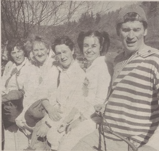
San Martin Eskolan nagusiak ume bihurtu ziren egun batez.

Zapatuan eta martitzenean. Bietan nagusitu dira musika, dantza, kolorea eta irudimena: Aratusteen sena. Umeak eta ez hain umeak ibili dira jairik jai. Eta askotariko mozorroak erabili dituzte: egunerokotasunarekin lotutakoak ( Prestige -ren hondamendia, Iraken gerra...) edo ohikoagoak (animaliak, printzesak...). Zapatuan, 14 urtetik beherakoetan, Errobotak eta Bagabundoak izan ziren garaile. 14 urtetik gorakoen artean, Lamak eta Nekazari atzeritarrak izan ziren garaile. Eta orijinaltasunaren barruan, Nam-Nam taldea eta Inportante (asto eta guzti). Datorren urtean gehiago!