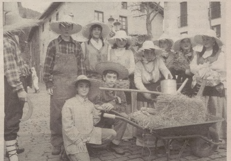
Orgatila eskuan eta txapela buruan zutela etorri ziren atzerriko baserritarrak.