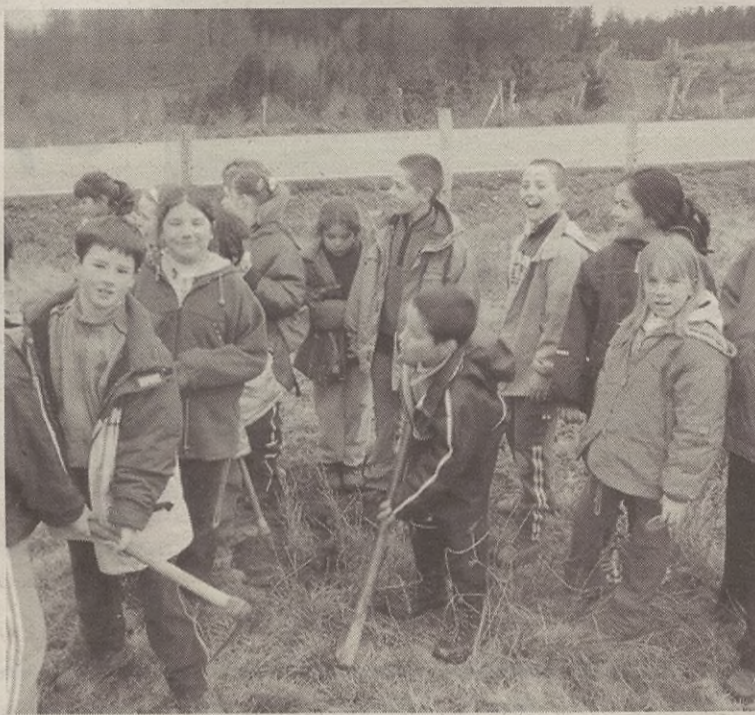
Zuhaitz horietako batzuk Zuhaitz Egunean landatzen dituzte.

Horregatik guztiagatik, Udalak uste du "ez dela legezkoa hainbat ganadu jabek duten jokoera, euren abere-buruak besteen lursailetan sartzen uzteagatik".