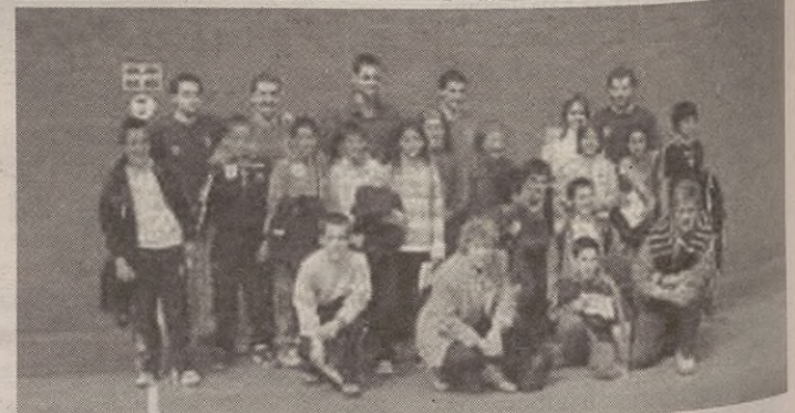
SAN MARTIN ESKOLA

Bertsotan eta pilotan ibili ziren ikasleak barikuan Legutianon.