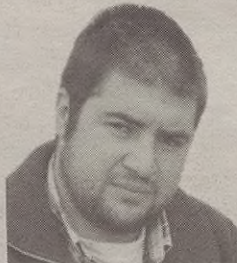
"Euskal Herria herri bat da Aturritik Ebroraino"

Izan ere, gure herriaren aurka dagoen gurutzadak herritar asko espetxera eraman