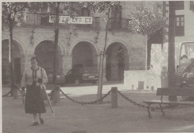
Ekainaren 10era arte lanean jarraituko dute Udaleko batzordeak.