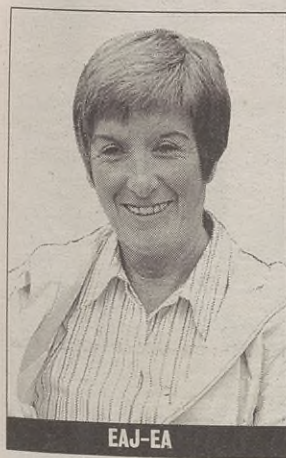
EAJ-EA MERTXE MONDRAGON