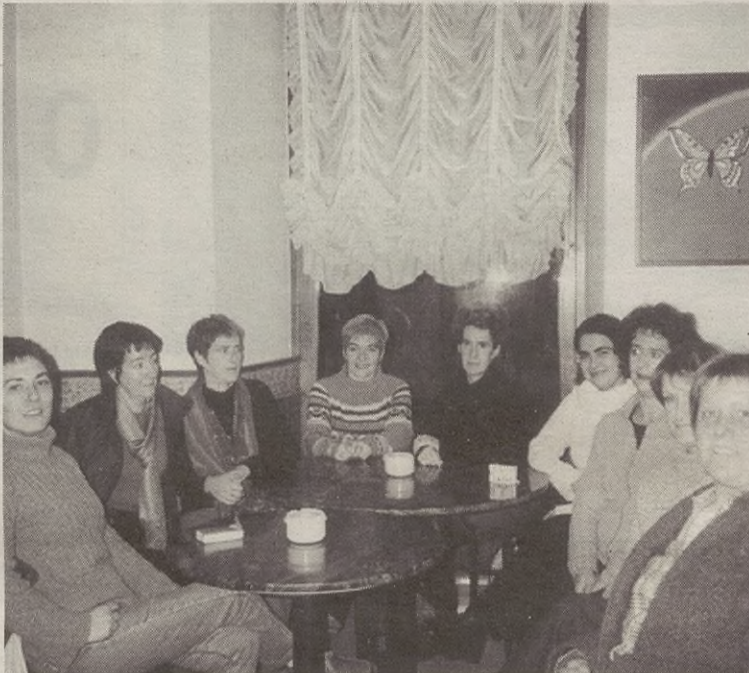
ITUR ZURI EMAKUME ELKARTEA