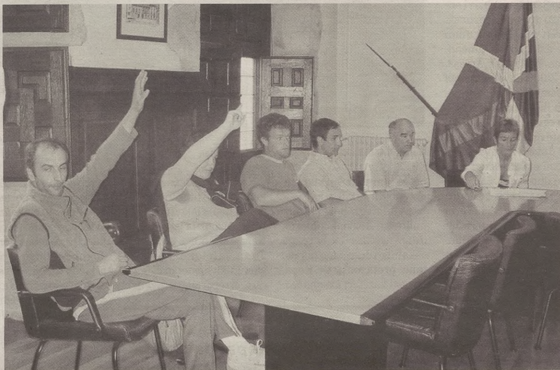
Hamalau plataformako kideak euren ustez euren dagozkien lekuetan eseri ziren.

Hala, legeak agindutakoari jarraituz, zinegotzi zaharrenak eta