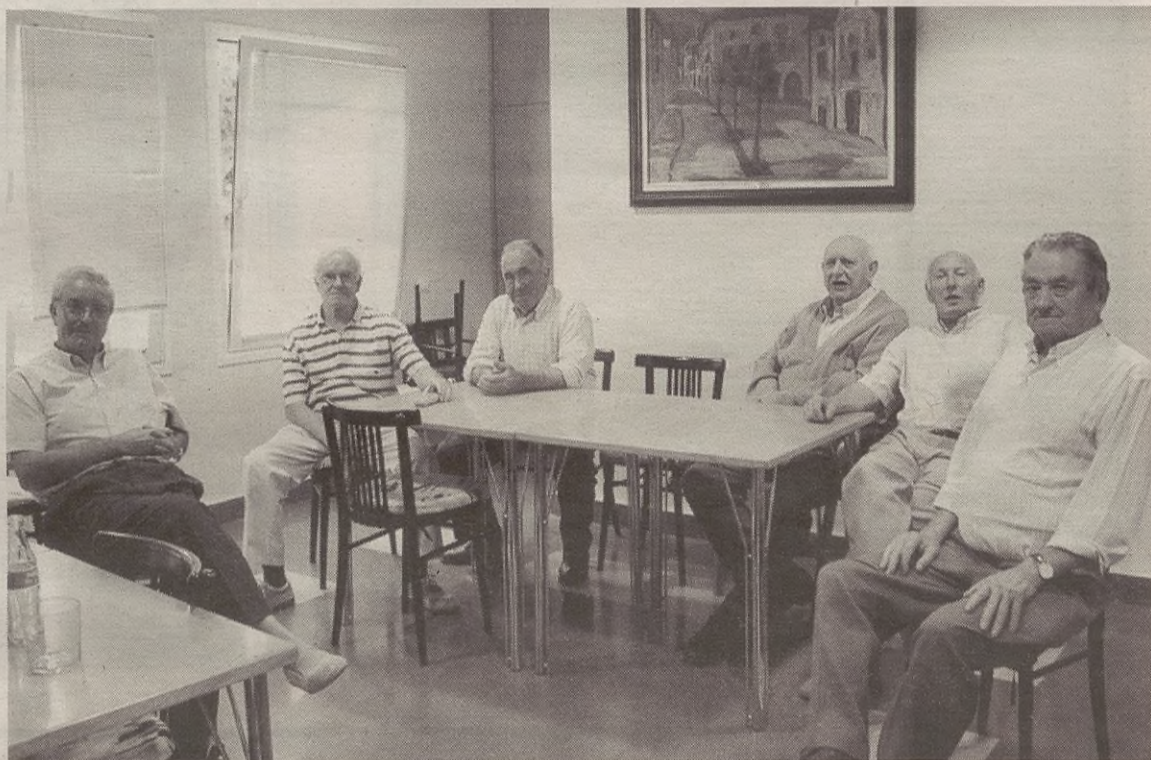
Besteak beste, pertsona nagusiak horrenbeste kezkatzen dituen osasunaren gaineko berbaldia izango da Kultura Astea.

Horrez gainera, eguenean txango kulturala antolatu dute. Goizean, 10:00etan irtengo da autobusa, eskolatik; eta Gasteizko Artium museoa ikustera joango dira lehenengo. Horren ostean, beste museo bat ikusiko dute, ardoaren gainekoa, oraingo