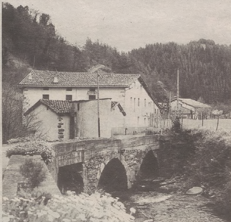
Oraindik ez dago adostasunik Udalaren eta Matxaingo zenbait bizilagunen artean.

Horrez gainera, eta lanak alde batera utzita, Hamalau taldeak egindako eskaera aztertu beharko dute zinegotziek. Hain justu ere, zinegotzi diren neurrian, Udaleko aktak, deialdiak, eta abar eurei ere bidaltzeko eskatu dute.