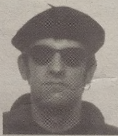
Asuntoa da nork kulunkatzen duen sehaska

joaten zen jende falta dagoela gaur egun, Salvador Allende gogoratu. Jendeak beste era batera ikusten dituela gauzak. Ez dagoela lehengo bizirik, ametsik, zapata apurtuz beteta ditugula memoriaren kajoiak. Trantsizio garaiko Euskal Herrian etorkizunak jaten omen zuen oraina, guztia egiten zen aurrera begira, bizirik zeuden baita harriak ere, esperantza arnasten zen