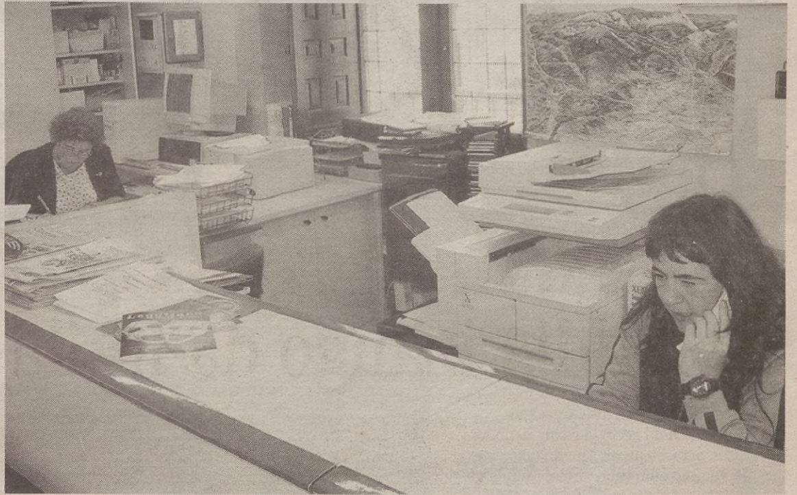
Lehenengo solairuan dagoen harrera-bulegoa goiko solairuan ipiniko dute, lehengo liburutegia dagoen lekuan.