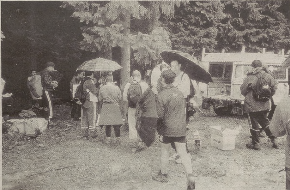
ORIXOL MENDI ELKARTEA