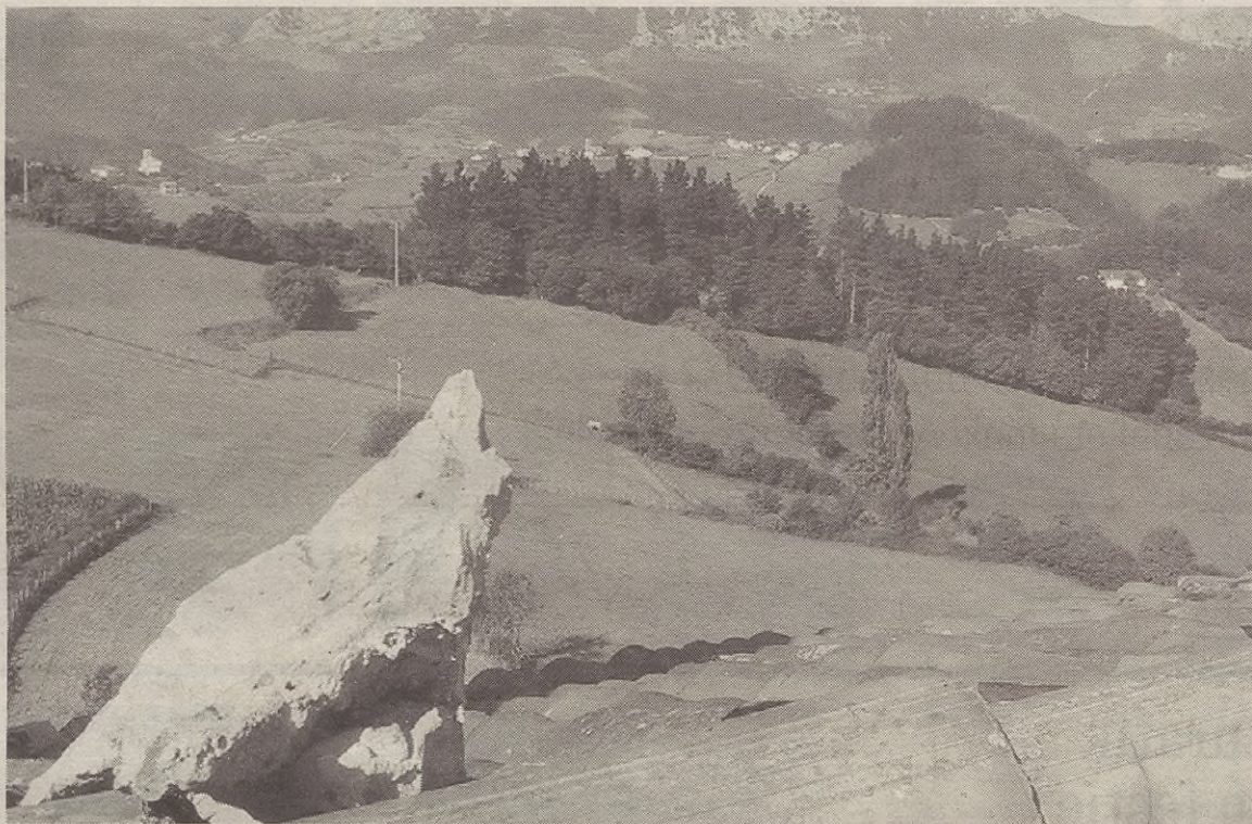
Irailean aukeratu dituzte alkateak auzoetan; batzuetan hauteskunde bidez eta beste batzuetan familien artean txandakatzen.

Aipatutako moduan, irailean auzoka alkateak aukeratzen ibili dira. Eta, orain, iraileko osoko bilkuran (17an), auzo bakoitzak hartutako erabakiak berretsi egin ditu Aramaio-ko udalbatzarrak.