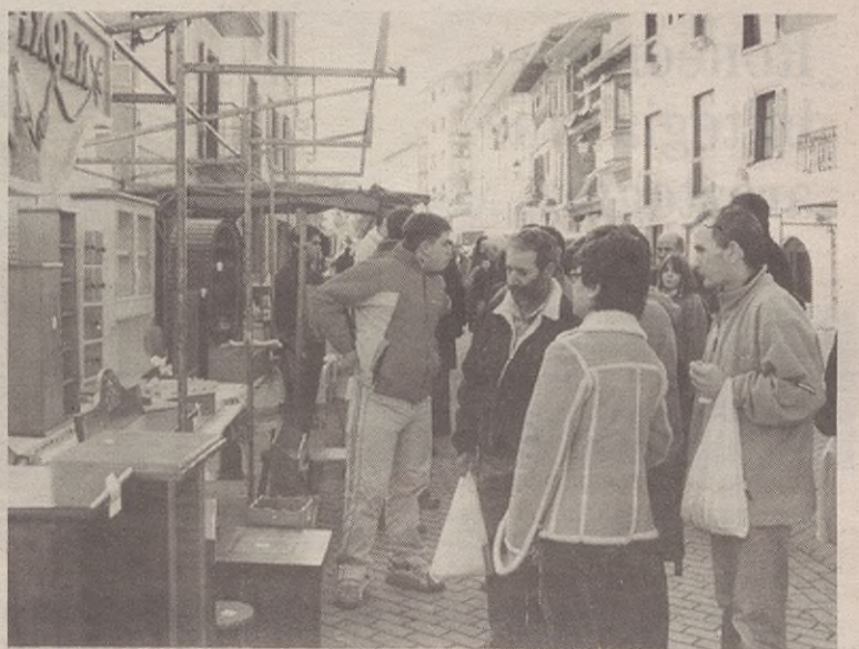
Lagun Artea dantza taldeak omenaldi beroa egin zien erretiratuari.