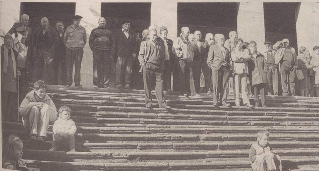
Erretiratu dezente elkartu zen mezan; gero, 165 lagunek bazkaldu zuten kiroldegian.