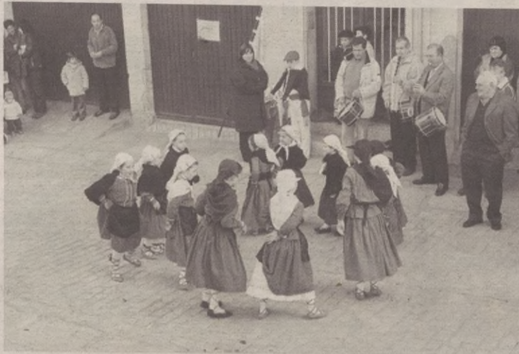
Erretiratuaren Egunean ohi denez, jende asko ibili zen kalean zapatuan.

Azokari dagokionez, handia izan zen; berritasunekin, gainera. Gogozintzarekin, tailarekin, ezgintzarekin... lotutako saltokiekin batera, errementaritzarekin lotutako erakusketa egon zen. Hortaz, gauzak erosteaz eta ikusteaz gain, ikasteko aukera ere egon zen.