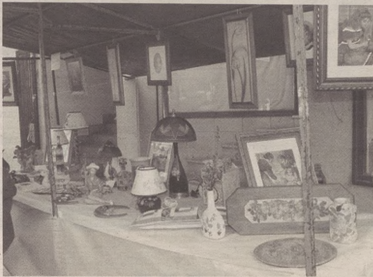
Herritarrek ipini zituzten saltokiak; tartean, Itur Zuri elkarteok.