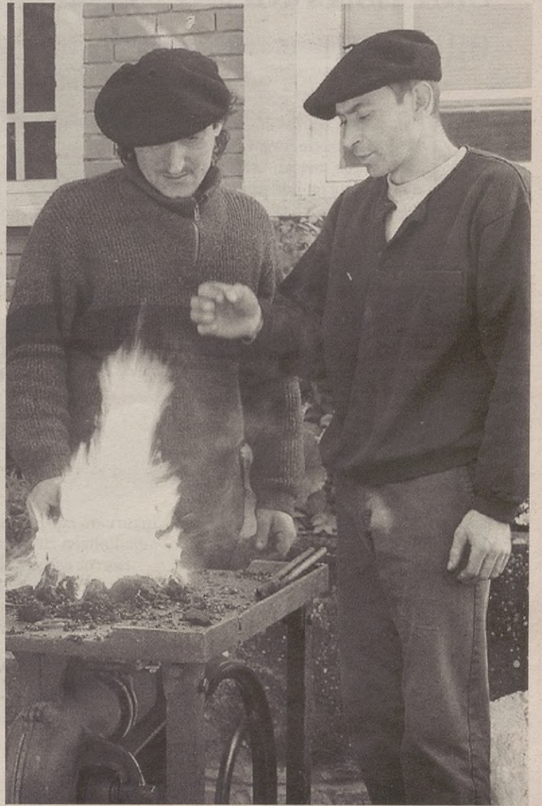
Errementariak zelan lan egiten zuten erakutsi zuten Suoker taldekoek.