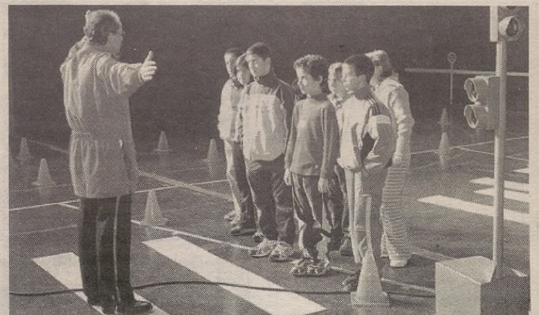
SAN MARTIN ESKOLA / GORKA MORRAS

Goian, umeak Barriako barnetegian; behean, bide hezkuntza ikasten.