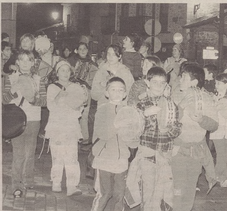
KALEJIRAN TRIKITIXA TALDEA

Hortaz, zozketarako txartelen bat izanez gero, ondo begiratu ezazue zenbakia, akaso bildotsen bat tokatu zaizue-eta.