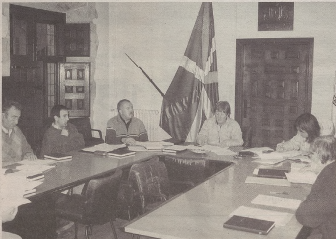
Besteak beste, gazte lokalen gainean gazteek egindako eskaera aztertu zuten zinegotziek.

KOORDINATZAILEA: Ubane Madera • Otolara Lizentziaduna 31 20500 ARRASATE • Tel.: 943 71 25 11 • Faxa: 943 71 23 89 • Posta elektronikoa: txirritola@goiena.com • Lege gordailua: SS.1084/02