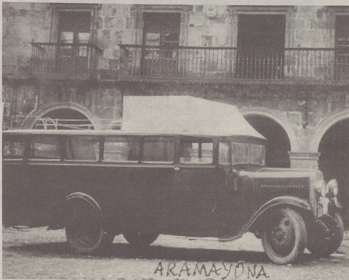
"ARAMAIO ETA ARRASATE, HISTORIAK LOTUTAKO BI HERRI" LIBURUA

Hortik aurrera, Arrasateko erreketaren gainean sakon ber-