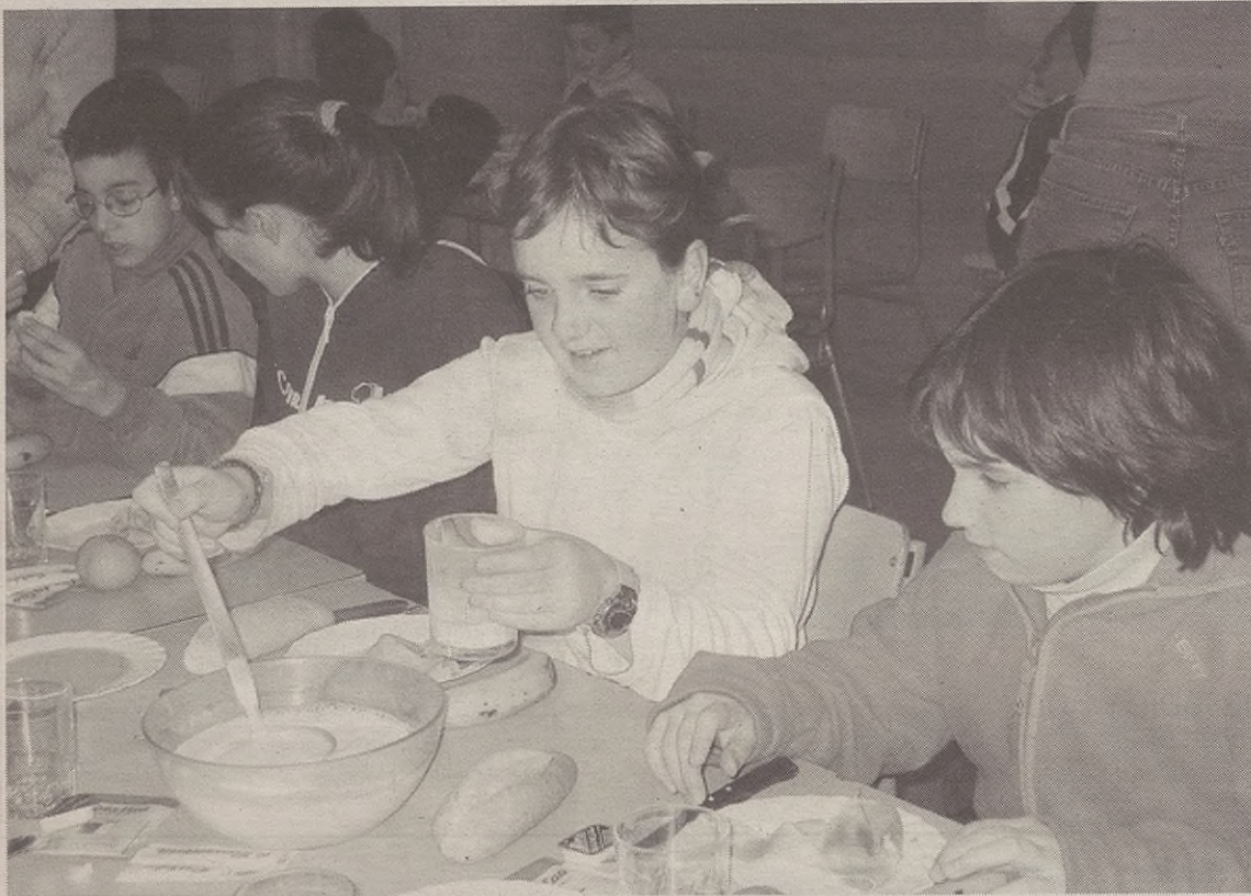
Martitzenean, bihotzerako eta, oro har, osasunerako egokia den gosaria hartu zuten ikasleek.

KOORDINATZAILEA: Ubane Madera • Otolara Lizentziaduna 31 20500 ARRASATE • Tel.: 943 71 25 11 • Faxa: 943 71 23 89 • Posta elektronikoa: txirritola@goiena.com • Lege gordailua: SS.1084/02