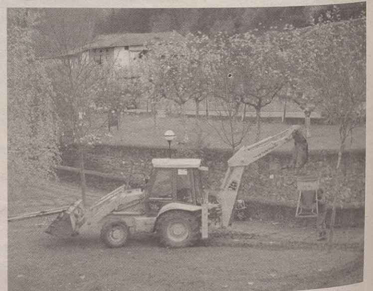
Santa Ana ermitatik Bañera parkera joan dira erreka bazterrak konpontzera.

Eta, orain dela aste batzuk jakinarazi genuen laster txabola bat konponduko dutela, gero etxer etxe batutako olio han gorde eta birziklatzera eramateko. Kontua da oraindik ez dutela txabola konpondu. Baina hala egingo dutela berretsi digute.