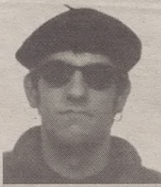
"Herri txikia BAINA hilkutxa batean sartua da Aramaio"

b) Aramaio (ai, Aramaio). Herri txikia BAINA hilkutxa batean sartua da. Gaztetxerik ez dago, gazte asanbladarik eratzeko inondiko borondaterik ez dago, mugimendurik ere ez (beti geldituko zaigu Anboto, baina...), siesta permanente batean dagoen herria, oesteko herri-fantasma,