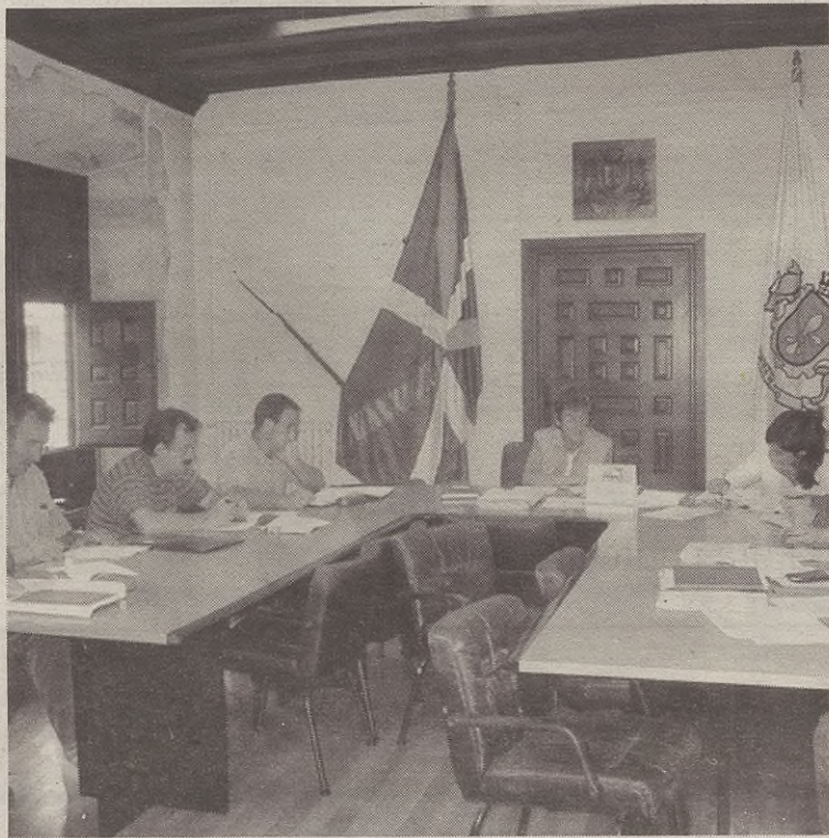
Askotariko gaiak izango ditu aztergai udalbatzarrak.

Bestalde, Azkoagako abadetxea berbagai izango dute. Arkitekto eta geologo banak eraikin haren egoeraren gaineko txostena egin