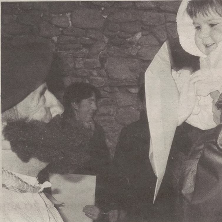
Gabon kantak entzun eta gero, umeen gutunak batzen hasiko da Olentzero.

Eta, bukatzeko, abenduaren 26an, txikienek puzgarriak izango dituzte; pilotalekuan egongo dira, goizean, 11:00etan hasi eta