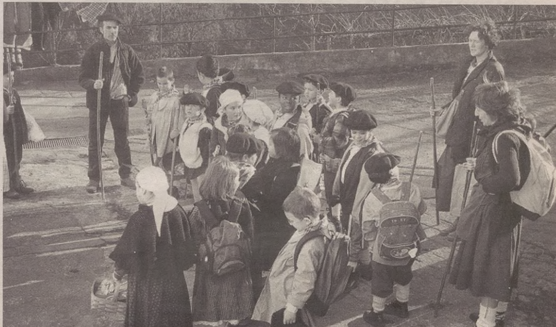
Zabala auzoan eta inguruan lehenengo eta bigarren mailako ikasleak ibili ziren, eta denetik batu zuten baserrietan.

Halakoetan ohi denez, denetarik batu zuten umeek: jakiak zein dirua. Hala, gero, batutako jakiak eskolan jango dituzte, jolas-orduetan (intxaurrak, urrak, txorizokak...). Eta diruari dagokionez, urtero moduan eskolak dituen beharretarako eta ekimenak egi-