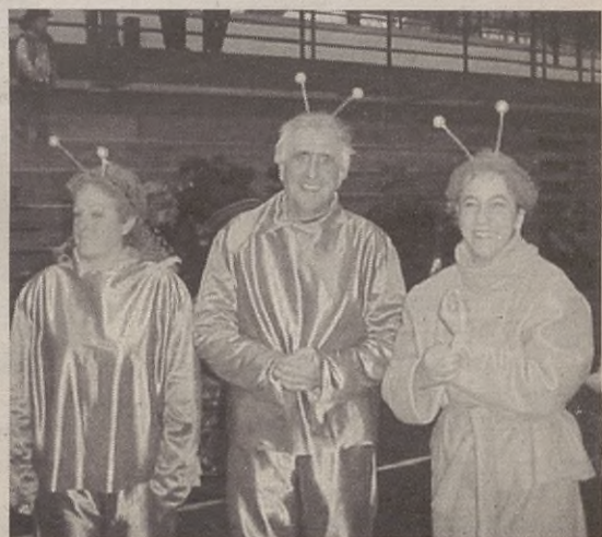
Joaldunen eta Basabixiloreen eta Atorren taldea, zenbait martetar eta trikitalariak.