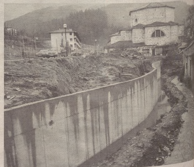
Erreka gaineko aldetik pasabidea egingo dute, etxeen ostean.

Egiten dabilta lanen artean erreka ondoan eraikitzen dabilta zana pareta ikus daiteke. Alkateak argitu digu erreka gainean dauden pasabidea egingo dutela eta horretarako dela. Edozelan ere, zenbait herritar ez daude aldeko paretarekin, besteak beste, ez dutelako erreka errespetatzen, eta aurrera begira erreka lantzeak eta haztea ezinezkoa egingo duelako. Gainera, zalantza dago hori egitea legezkoa den.