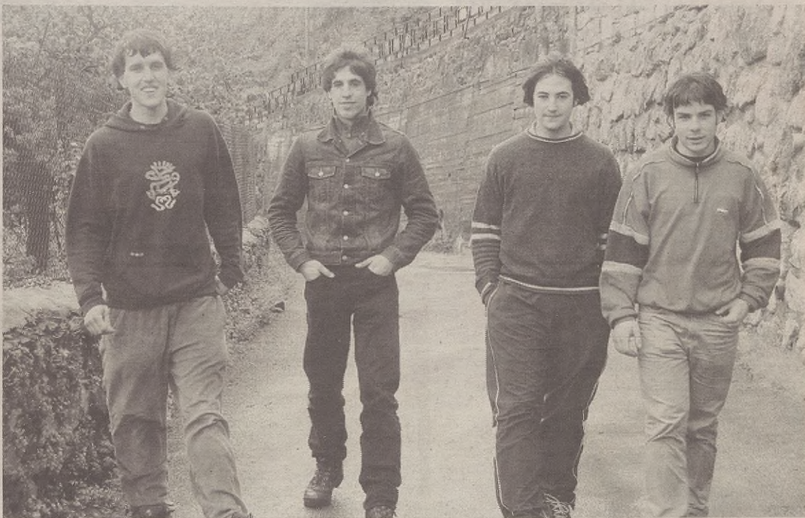
Aramaion ospatutako Lehenengo Gazte Egunean kontzertua egin zuen Ataka taldeak aurreneko aldiz.