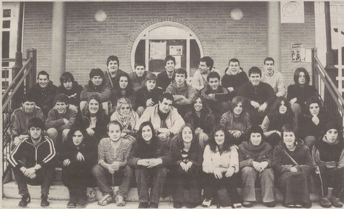
Aramaioko 50 gaztek bat egin dute Aramaixo Tropikaleko Gazte Asanbladarekin.

Horrez gainera, eta Udalarekin elkarlanean, herriko San Martin jaiak antolatzen dabilta gazteak buru-belarri. Aurreikusitako aurrekontua dezente murrizta dela-eta, ekimen bereziak antolatzen dabilta, jai alternatiboak