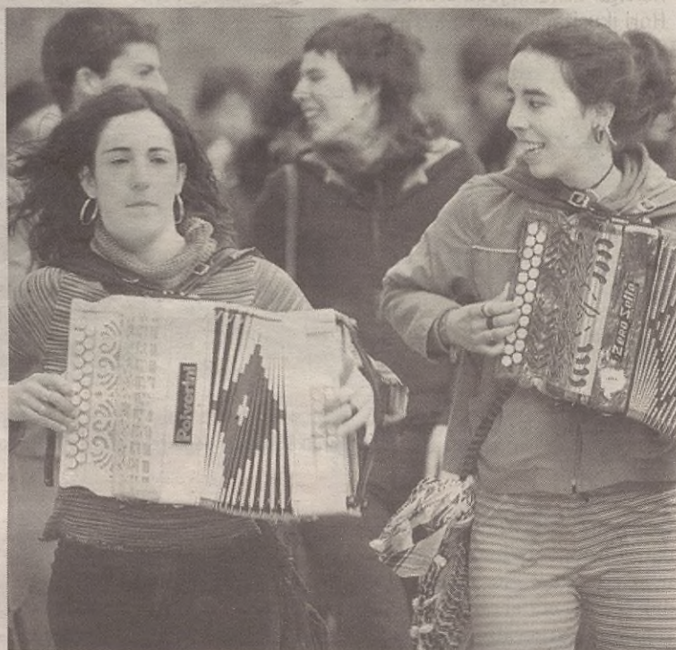
Herriko trikitilariak ere parte hartuko dute esaera zaharren lehiaketan.

Hala, Aramaioko kasuan, 19:00etan hasiko dute ekitaldia. Herriko bertso eskolakoek, herritarrek eta trikitilariak parte hartuko dute ekimenean. Bertso eskolako kasuan, bi talde osatuko dituzte eta tabernaz taberna ibiliko dira, tokatu zaizkien esaera zaharrek bertsoen bitartez esaten. Trikitilarien laguntzarekin egingo dute ibilaldia.