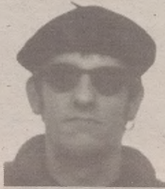
"Soluzioa Amurizari aurreko batean irakurri niona da"

Horixe baita, hain zuzen ere, euskara batuak gaur egun daukan herren handienetako bat: gazte hizkera eraginkor baten formazioa, euskara bizi eta fresko batena, transmisioan dugun eten horri aurre egingo diona, eta ze kristo,