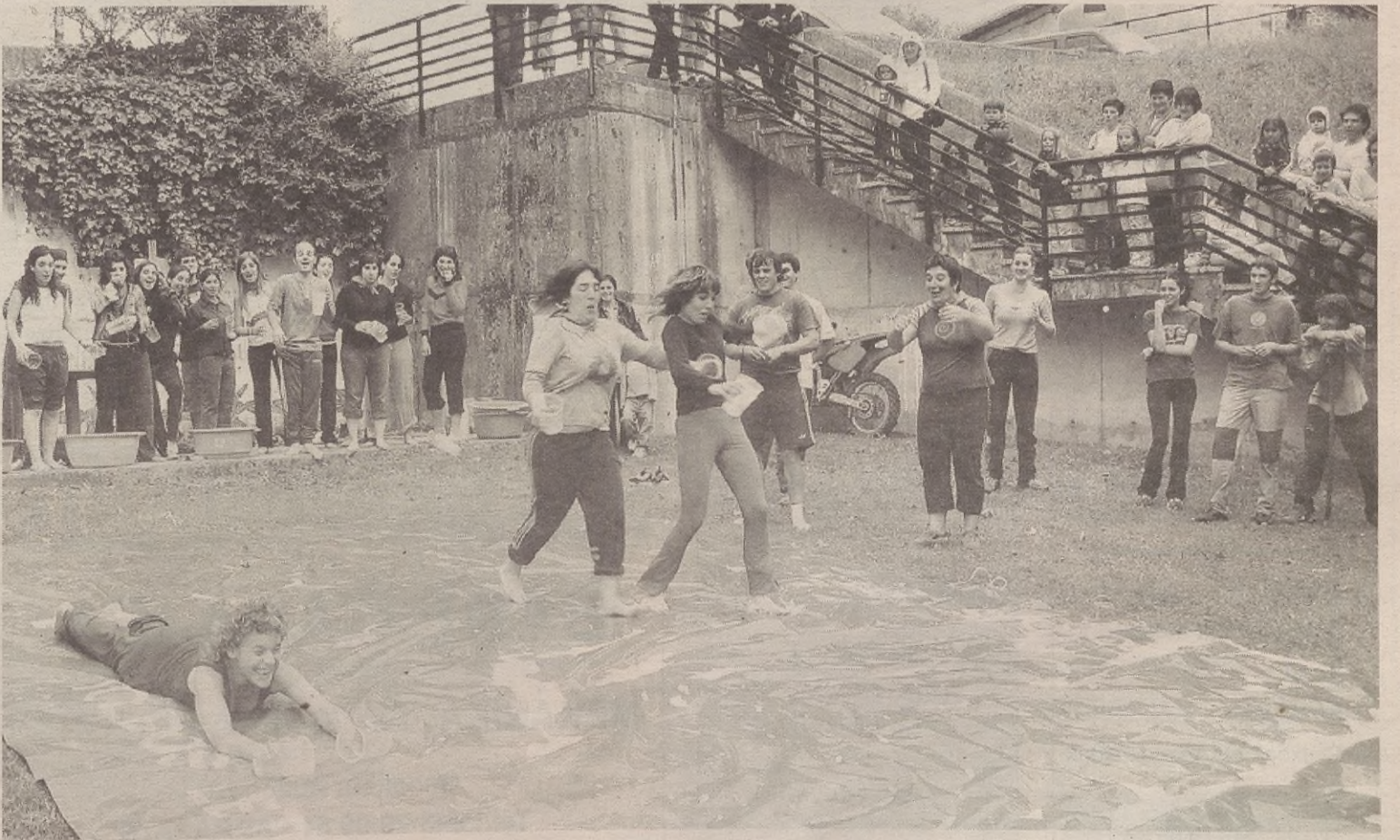
Kuadrila arteko pikie arrakasta handia izan zuen parte-hartzaileen eta ikusleen artean; batez ere, Katxitoldo jolasak; hori bai, kolperen bat zein beste hartu zuen gazteek.