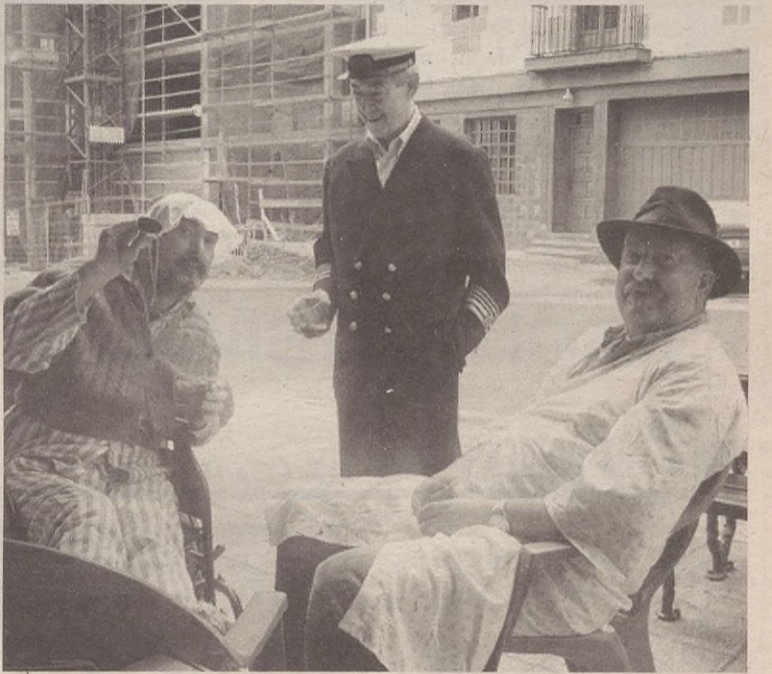
Astelehenero ohiturari eutsi eta arratsalderako mozorrotuta zebiltzan batzuk.