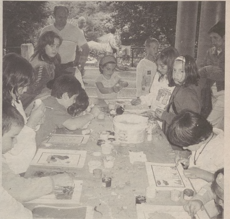
Gaztekoenak ederki asko ibili ziren jolasean eta lantegietan parte hartzen.