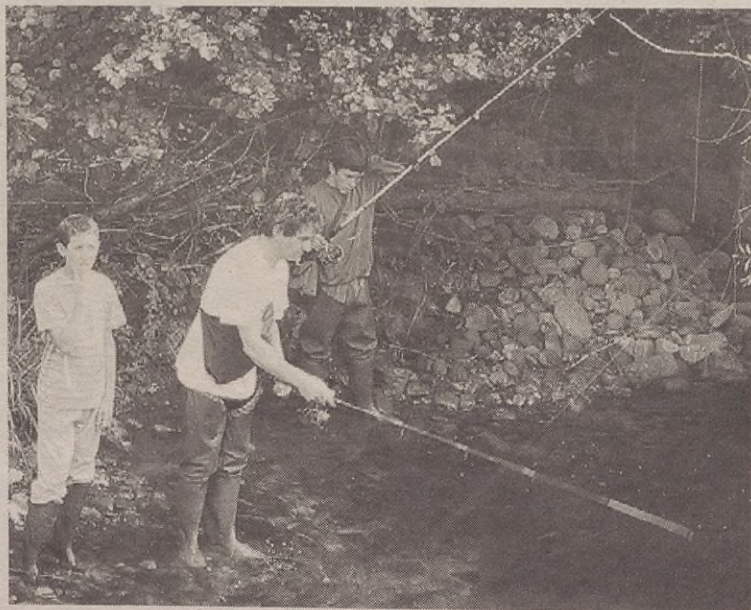
200 bat amuarrain askatuko dituzte errekan arrantza lehiaketarako.