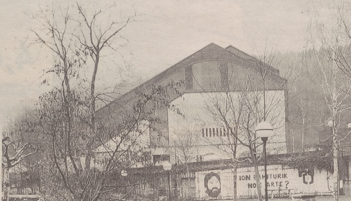
Kiroldegiak itxita segituko du harik eta kiroldegiaren kudeaketa esleitzen duten arte.

Kale garbiketarekin batera, alkateak jakinarazi digu beste bi