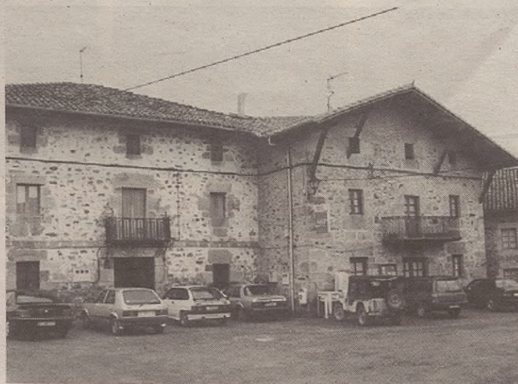
Aurreneko egunean, andreek egindako eskulanean erakusketa ipiniko dute, plazan.

Eta lehen esandako moduan, abuztuaren 15ean, Arabako Foru Aldundiak antolatuta, Zirko Ttipia izeneko taldearekin umorezko antzerki-saioa egingo dute Oletan. Giriguai lana antzeztuko dute, 18:00etan.