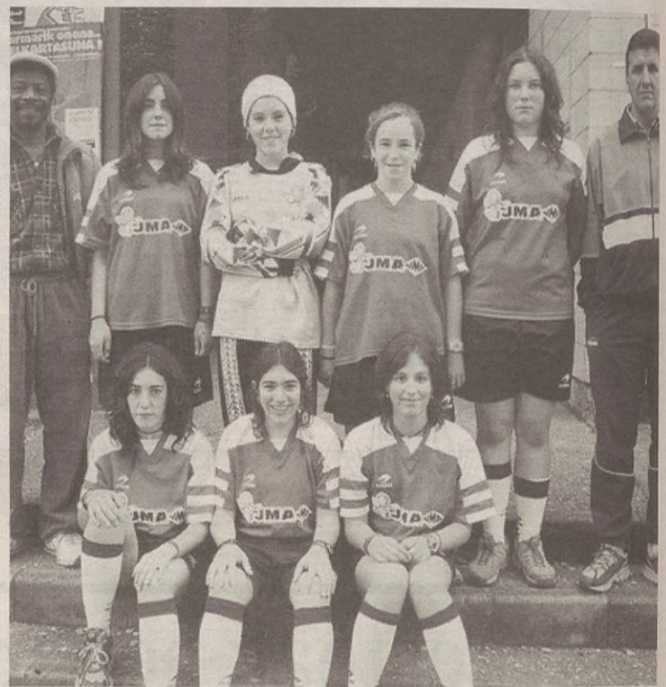
Elkartearen kirolariak eta gertu leudeke elkartearen jarraitzaileak.

Urte luzez senior mailakoekin ibili dira Bañerakoak eta haien taldea desagertu zenean, eskolako umeekin hasi ziren. Gaur egun hala zebiltzan, ikasle ez osatutako bi talde zeuden Bañeraren barruan: mutilen talde bat eta nesken beste talde bat.