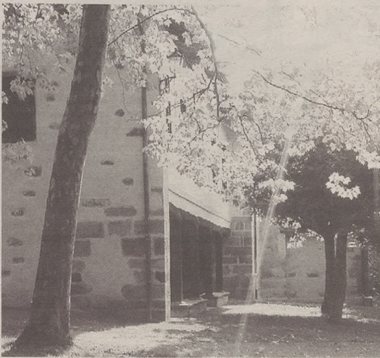
Zapatuko eta domekako ospakizunak Andra Mari ermitan egingo dituzte.

Eta domekan, Ibabeko Andra Mari kofradiaren eguna izango