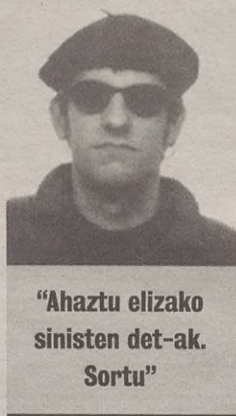
"Ahaztu elizako sinisten det-ak. Sortu"

Nire lagun batek kontatu zidan aurrekoan urtetan izan zuen akats bat: Negu Gorriak-en Bi doberman beltz, bilatzen ta suntsitzen errepika famatua Victor Manuel, atentatuz hil zen kantatzen zuen