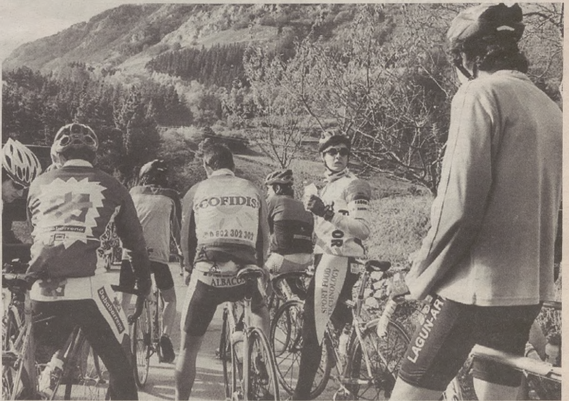
Domekan, urtero moduan, Gantzagako XXIV. txirrindulari igoera egingo da.

ZAPATUA, EGUN HANDIA Goizeko bederatzietan ekingo zaie ospaketei, kanpainen errepikarekin eta etxafuego jaurtiketarekin. Eguerdian, ohi bezala, meza nagusia esango da Aretxabaletako abesbatzak kantatuta. Meza