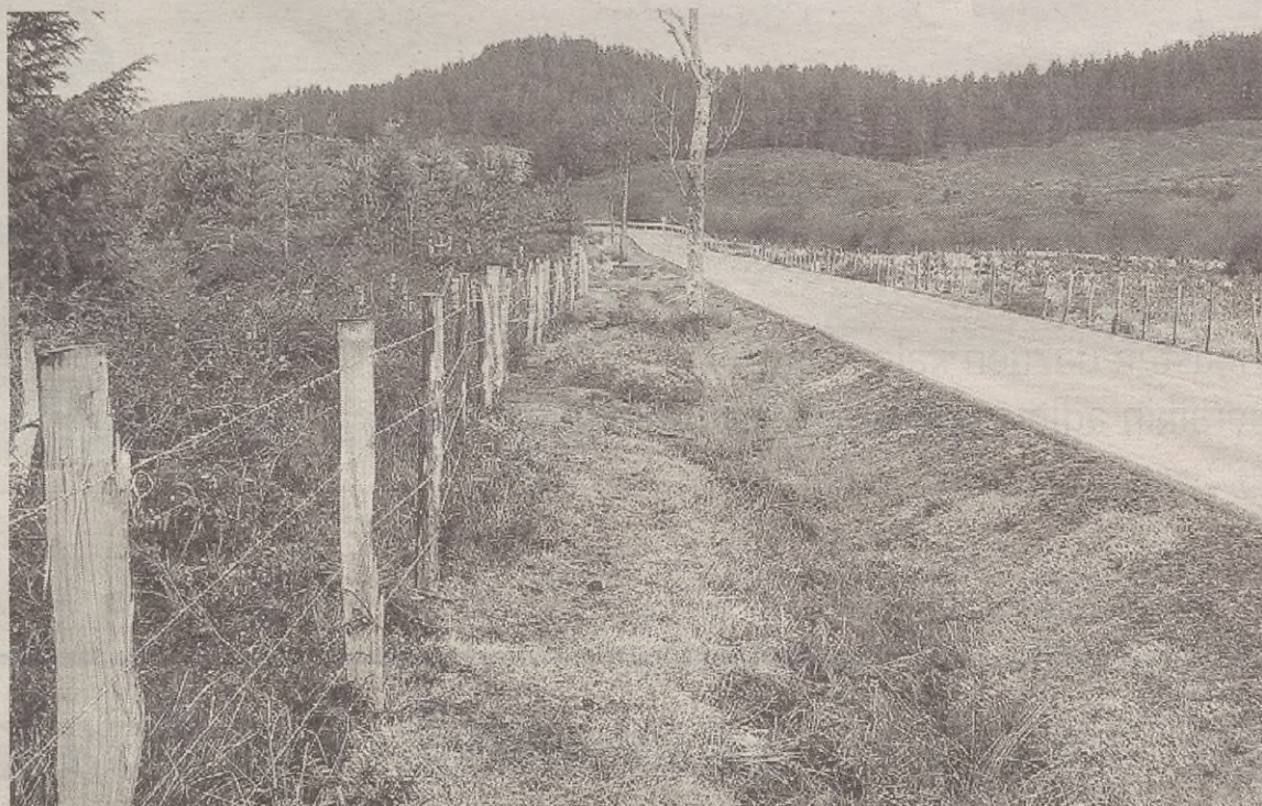
Hesi barik, larreetan dabilen ganadua —batez ere zaldiak— errepidera ateratzen zen eta istripuak eragin.

Baina horrekin batera kontatu digu 2002an bertan hesi horren kon-