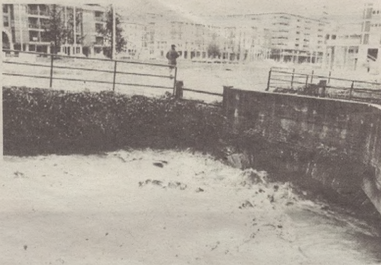
≈ 1994 Euriteek eraginda, goiko argazkia atera zutenean Deba ibaia gainezka egin zuen hainbat lekutan.

O ndoan dauden bi argazkiak dira Zerrajera eta Laubideko plaza batzen zituzten zubienak. Argazki zaharreko zuba, baina, orain dagoena baino gorago zegoen. Orain dela bederatzi urte hasi zituzten Euskal Herriko beste ibaiekin batera Deba ibaia garbitzeko lanak. Eskoriatzatik hasi eta Debaraino egin zituzten garbiketa lanak. 75 metro garbitzen zituzten egunero.