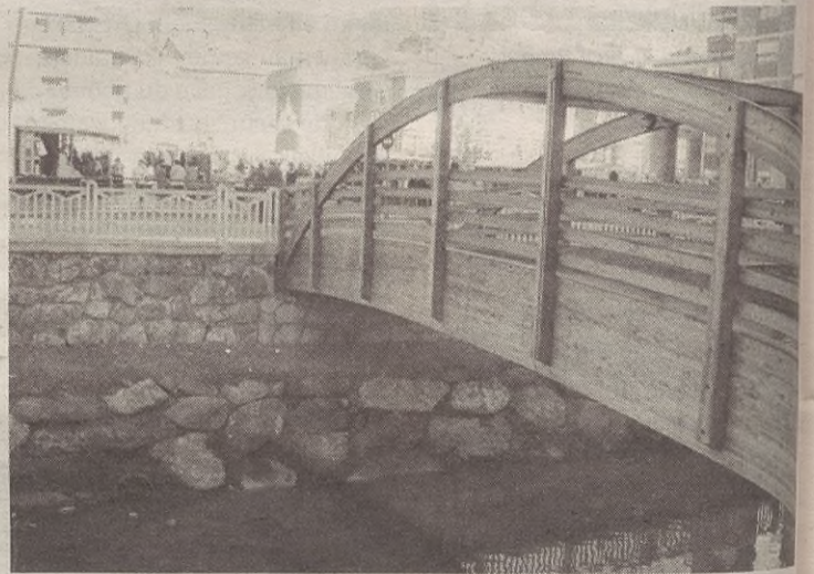
2005 Ibaia garbituta, uholdeek eragiten zituzten ondorioak txikitzea zen helburuetako bat. Aretxabaletan 23,5 tona zabor poltsa batu zituzten.