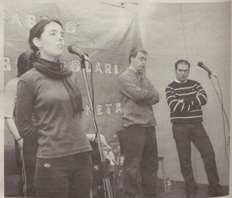
Iturrietan jokatu dute finala, 14:00etan hasita.

Besteak beste, honako lana egin beharko dute bertsolariak: ofizioa probak, besteen puntuei erantzutea, denak baten kontra eta kartzelako proba.