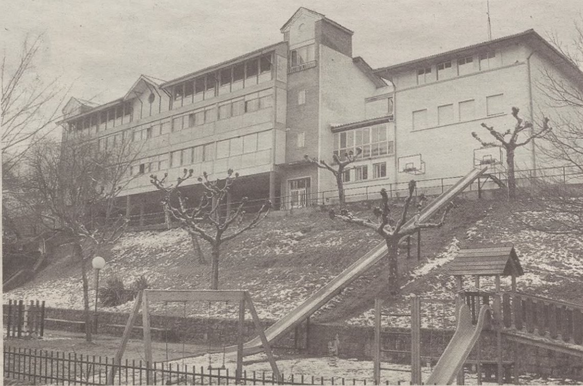
Aurrekontutik 120.000 euro pasatxo Haur Hezkuntza zerbitzurako eraikina egiteko erabiliko du Udalak; eskola ondoan eraikiko dute.

Bestalde, eskolako gela batzuk margotzeko daude. Hala, Udalak