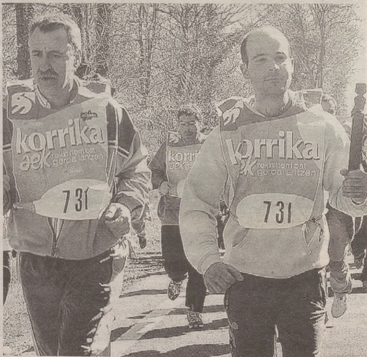
Orain dela bi urte ere fin-fin ibili ziren aramaiorarrak, Korrikan.