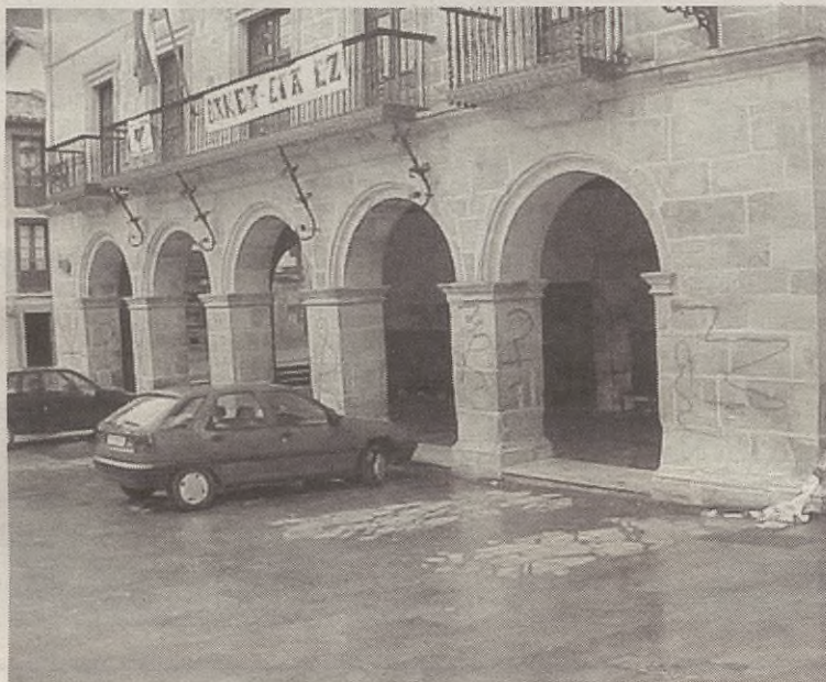
Presoen gaineko pankartarengatik ere izan zuen epaiketa Udalak.

Bestelakoan artean, alkateak jakinarazi digu, zailtasunak zailtasun, lortu dutela Etxaguengo auzotarrek nolabaiteko hitzarmena auzo hartan lanak egiteko. "Gutxieneko hitzarmena da; baina horri esker, datorren urtean, 2006an, auzoan azpiegiturak sartzeko proiektua egin ahal izango dugu". Halaber, egin beharreko proiektu eta lan guztiak auzoari begira egingo dituztela ere esan digu, hau da, Udalak egingen duen guztiaren berri eman gogoz diela etxagundarrei.