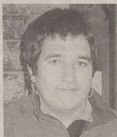
"Amamek poli bueno-ren papela jokatzeko dute"

Ez naiz oso ongi gogoratzen hasierako fase hortaz, baina pentsatzen jarrita, oso itogarria izan behar da haur batentzat. Amamak gizartean duen funtzioa hor ikusten da hobekien, pelikuletako poli bueno y poli malo bikote mitiko horretan, amamek poli