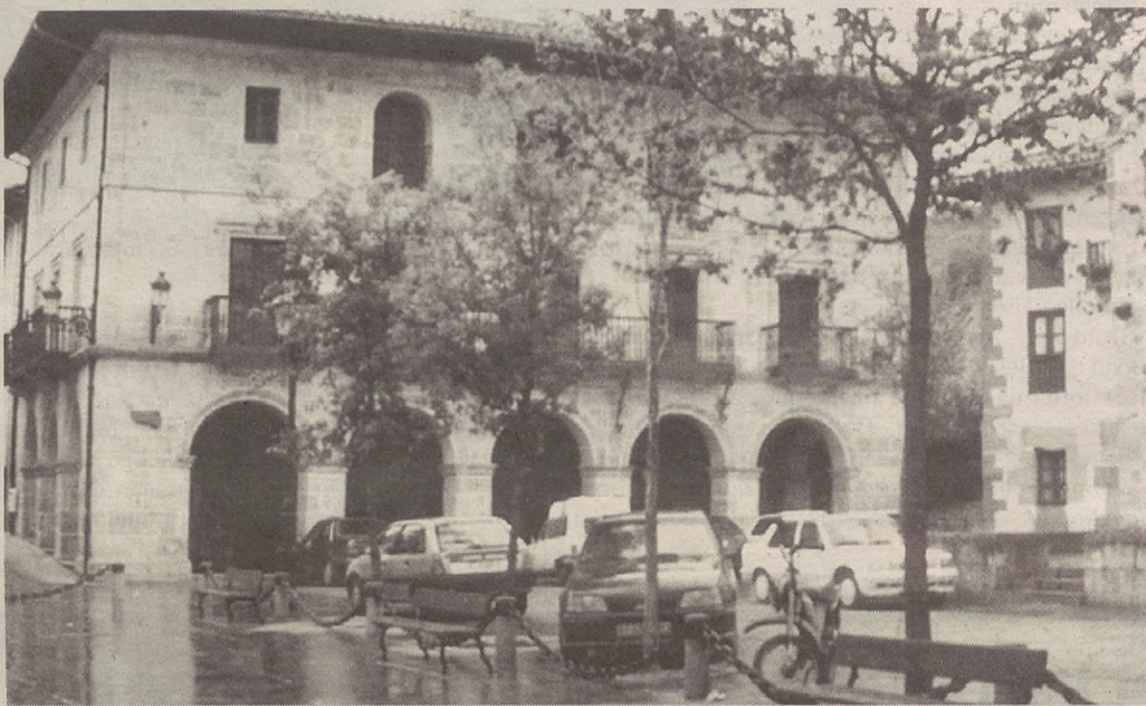
Dagoeneko hiru bider salatu du Udala Estatuko abokatuak; bi epaiketa irabazi ditu eta bestea galdu, baina ez diote zigorrik ipini.