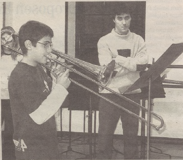
ARRASATEKO MUSIKA ESKOLA

Horrez gainera, Udako Euskal Unibertsitatera (UEU) joaten dire-