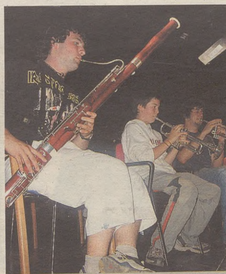
ARRASATE MUSIKALEKOEK JOKO DUTE