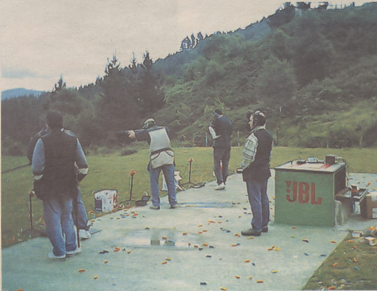
Aurten, gazteei eta nagusiei parte hartzeko dei egin gura diete Kurtzeta-Gain elkarteok.