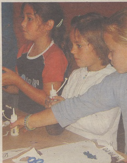
UMEENDAKO JOLASAK-ETA IZANGO DIRA