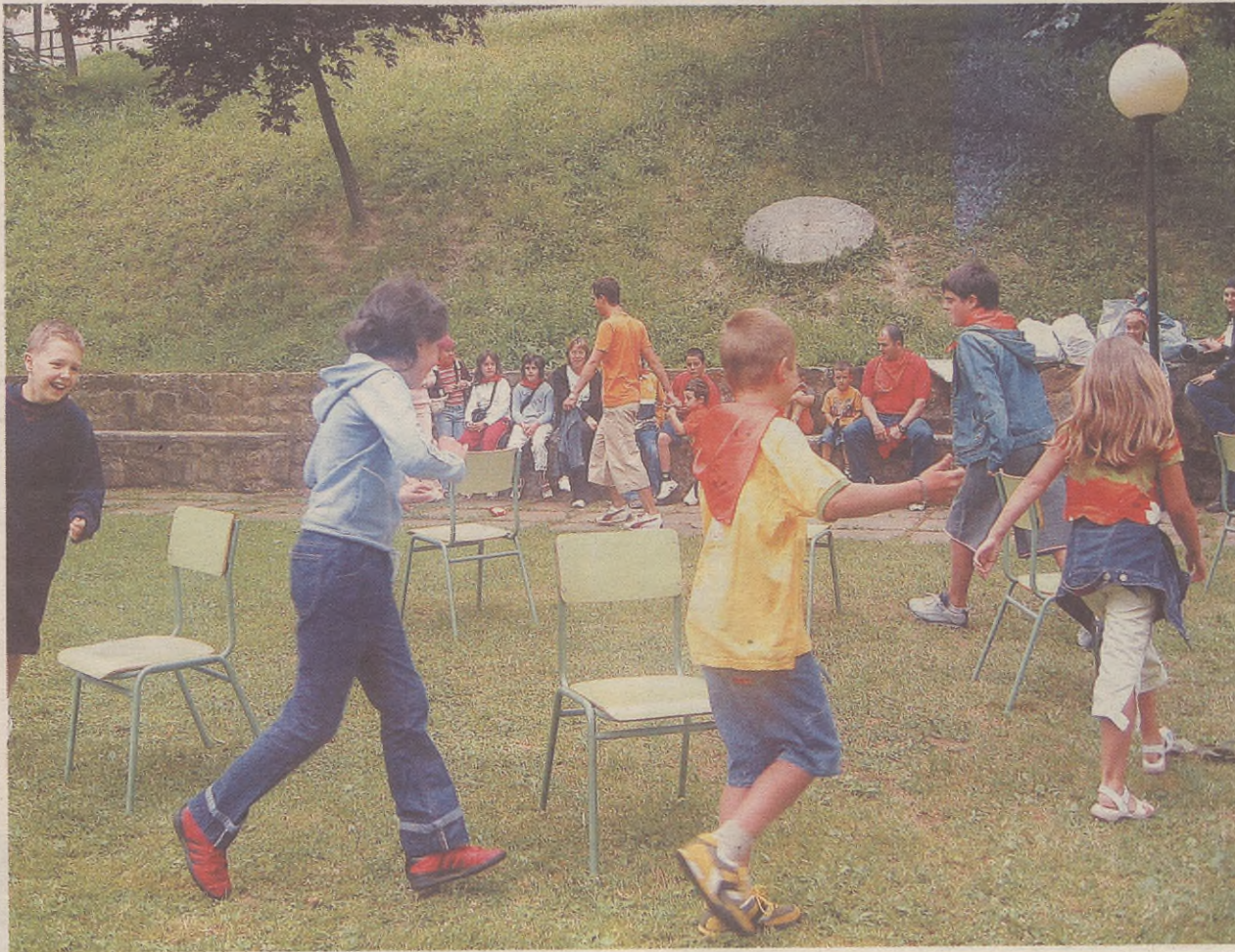
Iaz moduan, aurten ere ATGAK jolasak antolatu ditu umeendako, astelehenean 11:30ean, parkean.

Goizean besteei begira egon ostean, arratsaldean herriko gaztetxoak eurak bihurtuko dira ikuskizuneko protagonista. Izan ere, kultura etxean etorkizuneari izar