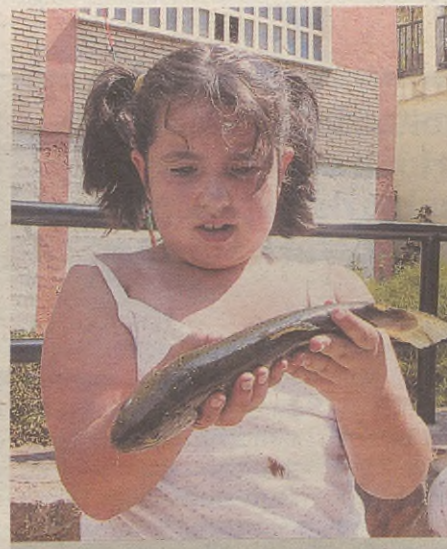
ARRANTZA TXAPELKETA ZAPATUAN DA