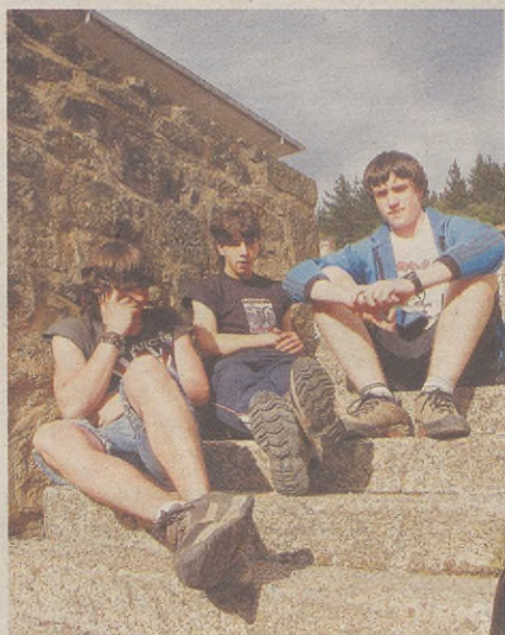
BARIKUAN, ZONA KATASTROFICAK JOKO DU