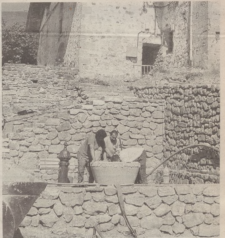
Itxura berritua erakusten du Arexolako plazak, baina oraindik ez dituzte lanak bukatu.

Bukatzeko, uztailaren 24an, besteak beste, sokamuturra izango da, 08:00etan, eta 17:30ean askotariko herri kirolak: Harri-jasotzaile Txapelaren Liga; Urrezko Aizkolari Txapelaren Liga... Gauean, berriz, 23:30ean, Izotz taldearen kontzertua.