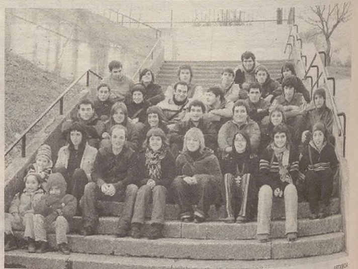
Aramaio Tropikaleko Gazte Asanbladak antolatutako du Gazte Eguna 05.