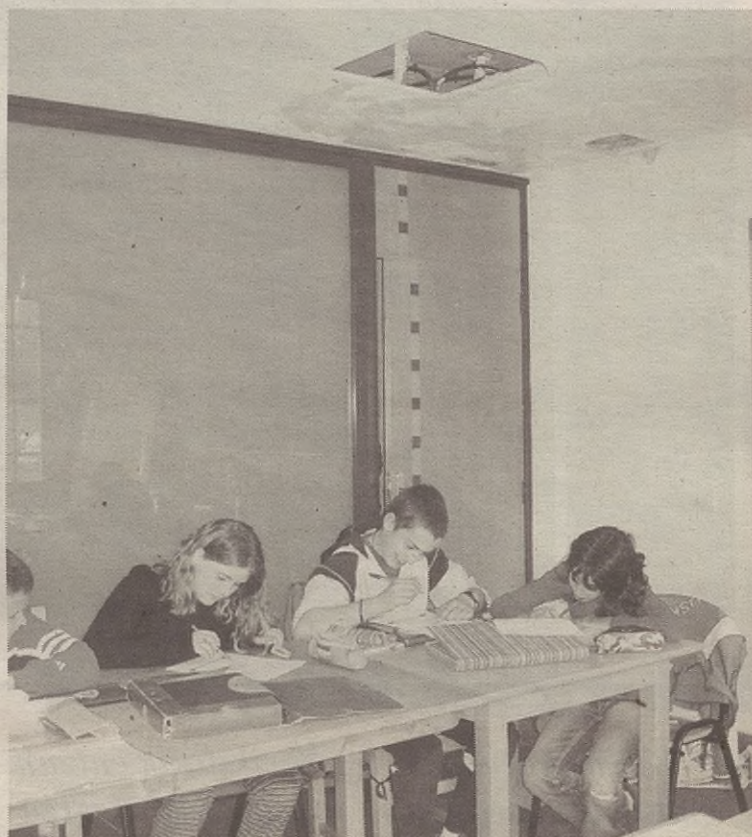
Eskuman ikusten dira kultura-etxe ingeles eskolan dauden itoginak; ezkerrean, berriz, kiroldegian arazoak sortzen dizkien apurtutako leihoa ikusten da.

Hasieran, hirugarren eta bigarren solairuetan izan zituzten iragazketak. Orain, berriz, bigarren pisuan bakarrik daude. Izan ere, iragazketak konpondu nahian, lanen bat zein beste egin izan dute, eta haiei esker, hirugarren pisukoak desagertu egin ziren. Ordea, bigarren pisuaren egoera eskas samarra da: KZGunean edukiontzi bat ipini behar izan dute izkina batean, eta bestean ontzi bat, sabaitik jausten den ura batzeko. Ingeleseko gelan, berriz, goiko